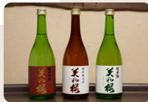
(写真左) 美和桜 純米吟醸酒 (前菜にお勧め) (写真中) 美和桜 特別純米酒 (お造りにお勧め) (写真右) 美和桜 純米酒 (みよし和牛すき焼きにお勧め)